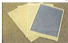
・カーボン紙 (宅配伝票の複写紙等) ・名刺用ホルダー