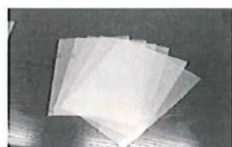
・クリアファイル ・クリアポケット ・香りのついた紙 ・(医療関係)レントゲン写真、シネフィルム等 ・感熱発泡紙 ・トレーシングペーパー(図面) ・プラスチック類等