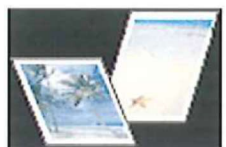
・写真(印刷は問題なし) ・アイロンプリント紙 ・滅菌紙 ・ビニール・布・革張り書籍 ・可燃ごみなど