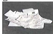
・感熱紙 (レシート用紙等) ・ポケットファイル