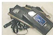
・ビデオテープ・FD